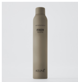
FIXER Stærk hårlak