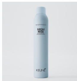
HIGH RISE Bund skum