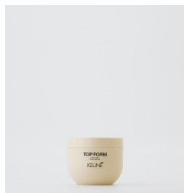
TOP FORM Restyler voks