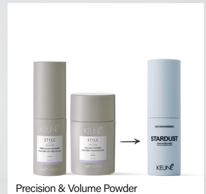
Precision &amp; Volume Powder