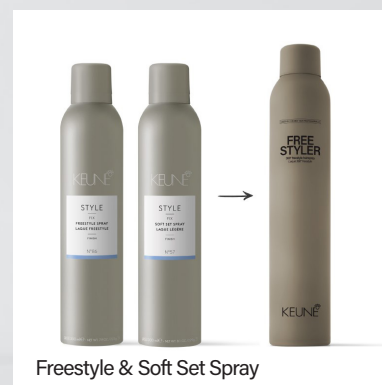
Freestyle &amp; Soft Set Spray