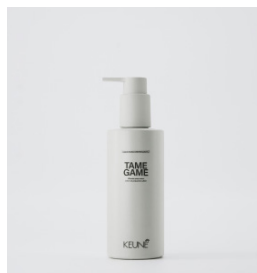
TAME GAME Ultimativ prep cream