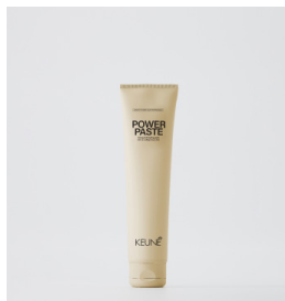
SPRING LOADED Nærende krølle cream