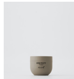
STAY PUTT Mat voks