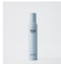
VELVET CLOUD Stærk mousse