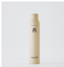
AIR WAX Letvægts spray wax