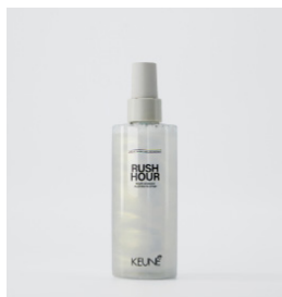
RUSH HOUR Hurtigere tørretid