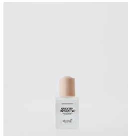
SMOOTH OPERATOR Blødgørende serum