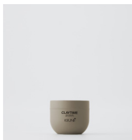
CLAYTIME Mat voks