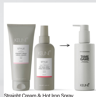
Straight Cream &amp; Hot Iron Spray