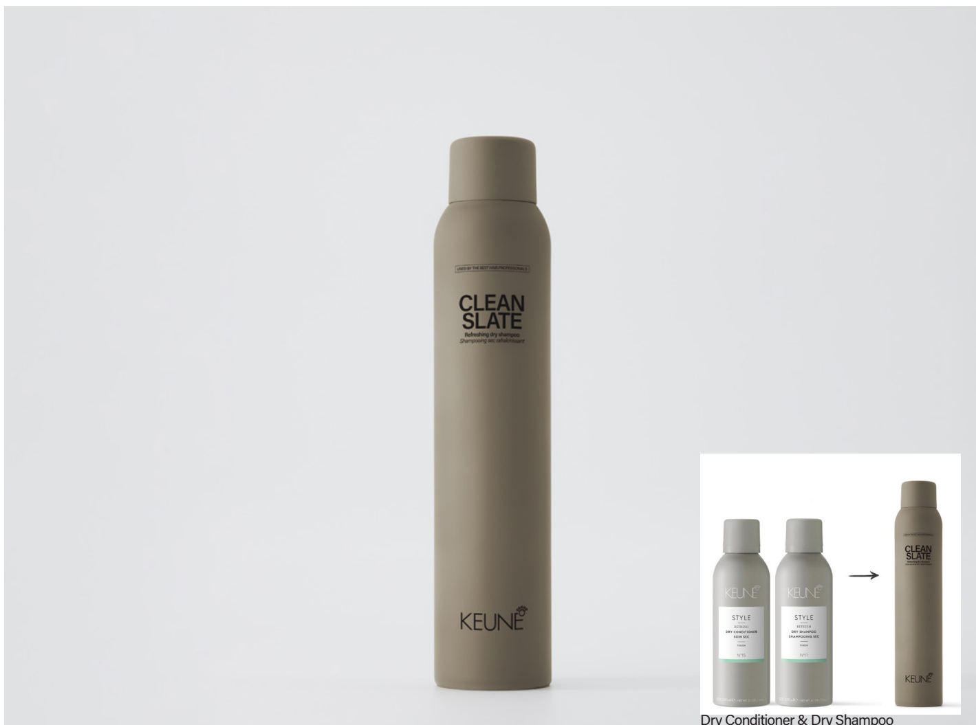
Dry Conditioner &amp; Dry Shampoo