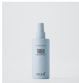
THICK TRICK Volumegivende og tykkende spray