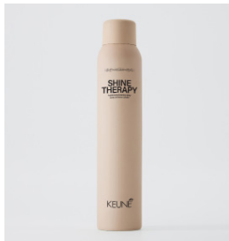
SHINE THERAPY Glans spray