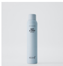
GET A GRIP Tør teksturende spray