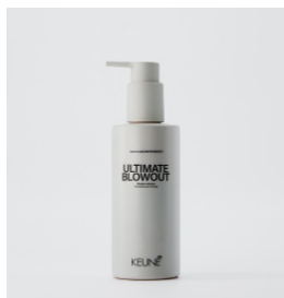
ULTIMATE BLOWOUT Førtør volumen