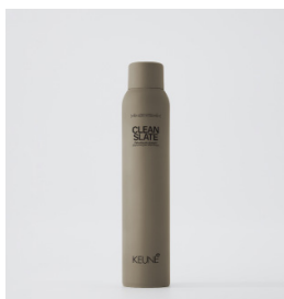
CLEAN SLATE Tør shampoo