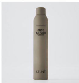
FREE STYLER 360° hårlak