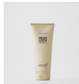
HEAD LOCK Medium glans gel