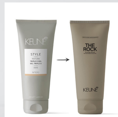
Triple X Gel