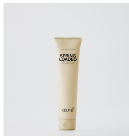
POWER PASTE Voks med stærkt hold