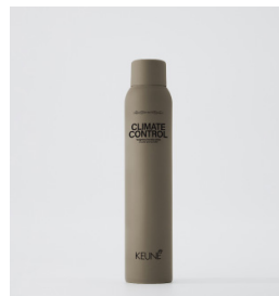
CLIMATE CONTROL Vægtløs fugtigheds skjold