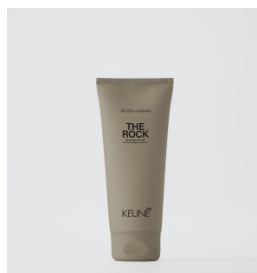
THE ROCK Stærk høj glans gel