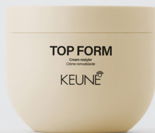
Forming Wax, Restyle Cream &amp; Fiber Wax