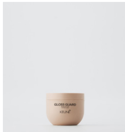
GLOSS GUARD Ultimativ glans voks