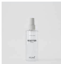
RESETTER Nulstillings spray