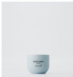
GOOD FIBES Fiber voks