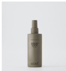
LIQUID LOCK Vådlak