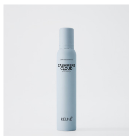
CASHMERE CLOUD Blød mousse