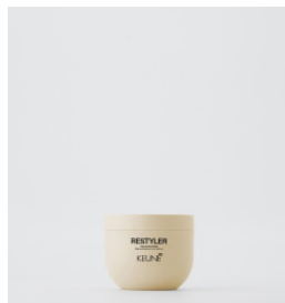
RESTYLER Voks med høj glans