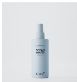
OCEAN WAVES Saltvands spray