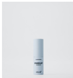
STARDUST Volume pulver